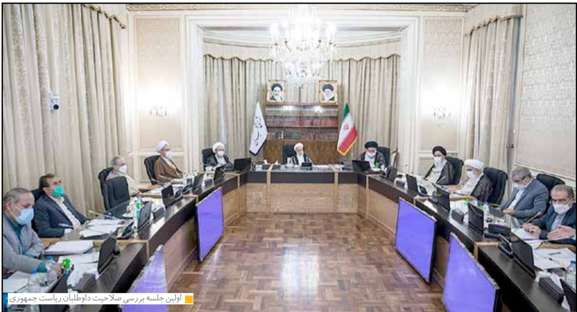
اولین جلسه بررسی صلاحیت داوطلبان ریاست جمهوری

سخنگوی شورای نگهبان گفت: از میان کسانی که برای ثبت نام کاندیداتوری در انتخابات ریاست جمهوری به وزارت کشور مراجعه کردند، مدارک حدود ۴۰ نفر با مصوبه اخیر شورای نگهبان منطبق بود.