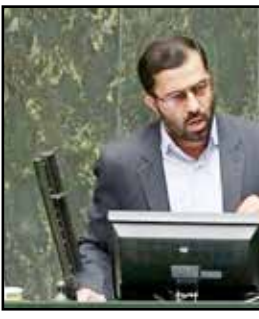
مسائل بخش‌های مشکلات حوزه اجتماعی است که در دولت آینده باید به‌طور جدی مورد توجه قرار گیرند.

بررسی وضعیت بازار کار سال ۹۹ بیانگر آن است که با ریزش ۷۴۳ هزار نفری نیروی کار بخش خدمات، ۱۷ هزار نفری بخش صنعت و ۲۵۰ هزار نفری بخش کشاورزی، حوزه خدمات رکورد ریزش نیرو بوده است. به گزارش خبرگزاری مهر، با توجه به محدودیت‌هایی که ناشی از شیوع ویروس کرونا در سال ۹۹ برقرار و بعضاً منجر به تعطیلی یا تعدیل نیرو در محیط‌های مختلف کاری شد، شاخص‌های بازار کار به شدت تحت تأثیر قرار گرفتند. براساس آمار رسمی کشور در مجموع ۴ فصل سال ۹۹ بیش از یک میلیون و ۱۰ هزار نفر از گروه شغلافان خارج شدند. بررسی وضعیت بخش‌های مختلف اقتصاد کشور در سال ۹۹ بیانگر آن است که اگرچه در بخش کشاورزی و صنعت نیز ریزش نیروی کار را شاهد بودیم اما بیشترین ریزش نیروی کار در بخش خدمات بوده است. در بخش کشاورزی حدود ۲۵۰ هزار نفر در سال ۹۹ به نسبت سال ۹۸ بیکار شدند. در بخش صنعت نیز شاهد ریزش ۱۷ هزار و ۵۰۰ نفر از شاغلان بودیم. بیشترین ریزش نیروی کار نیز در بخش خدمات رقم خورد به گونه‌ای که حدود ۷۴۰ هزار نفر فعالان حوزه خدمات در سال ۹۹ بیکار شدند. همچنین طی سال گذشته بیش از ۲ میلیون نفر از بازار کار خارج شدند و در زمره جمعیت غیرفعال قرار گرفتند که سهم زنان بیشتر از مردان بوده است.